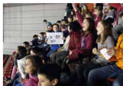
Le championnat de hockey féminin pour les classes de CE2 et CM2