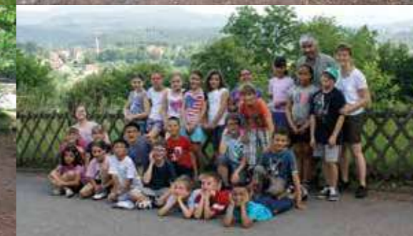
La classe verte à Plaine pour les CP, CE2 et CM1 au mois de juin

Pour l'année scolaire 2013-2014, les classes sont composées de la manière suivante : 24 élèves en CP, 25 en CE1, 27 en CE2, 24 en CM1 et 22 en CM2. Ce qui représente 122 élèves.