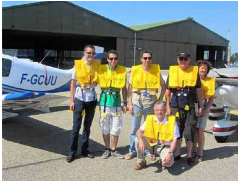
Les six membres du club prêts pour l'aventure, à la veille du départ en Corse.

Ces passionnés d'aéronautique ont décidé de sacrifier néanmoins une bonne partie de la semaine au tourisme estival, plages et sentiers qui font la renommée de la Corse. Histoire de lâcher quelques heures leurs tablettes numériques, où ils consultent assidûment les prévisions météo avant chaque décollage.