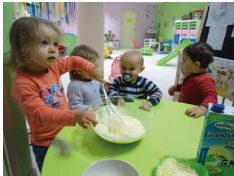
Un peu de cuisine

Toute l'équipe se tient à votre disposition pour vous faire une visite de la structure et vous pouvez nous joindre par téléphone au 09 84 07 54 07 pour de plus amples renseignements.