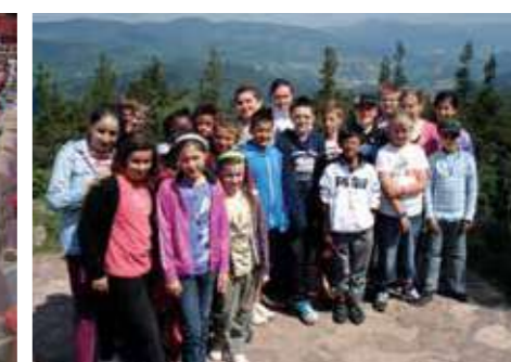
La visite des CM2 au mémorial du Lingé