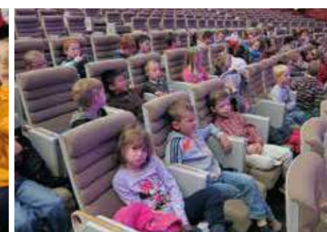
Le concert de l'orchestre philharmonique de Strasbourg pour les CP et CE1