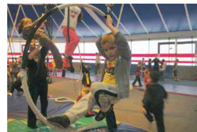
La classe de cirque a concerné les élèves des classes de CE1 et de CM2. Elle s'est déroulée au mois de novembre 2012.