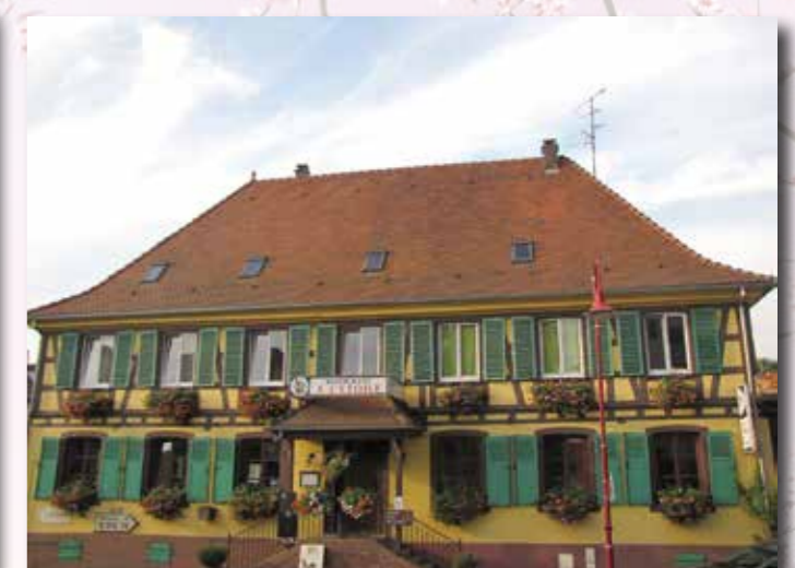
Commerces : Prix d'excellence Restaurant à l'Etoile