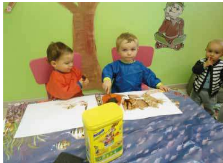
Atelier peinture au chocolat

L'équipe veille ainsi à la santé des enfants et à leur sécurité dans un lieu chaleureux et soucieux de l'éveil et du bien-être de chacun d'entre eux. Les enfants découvrent le monde qui les entoure en