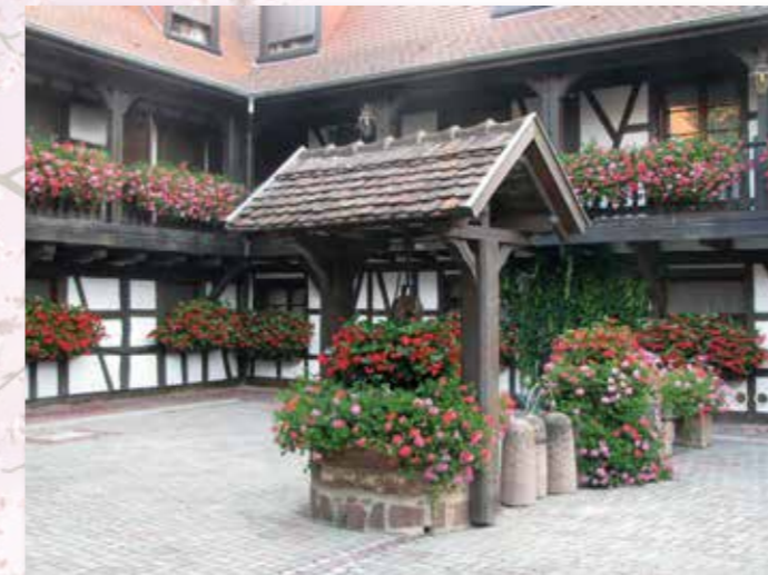
Commerces : Prix d'excellence Hôtel Père Benoît