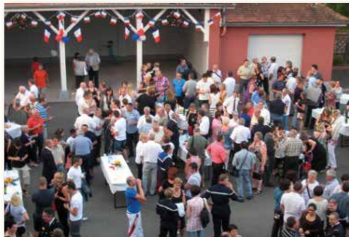
Tout le monde a ensuite été convié au vin d'honneur organisé dans la cour de la mairie.