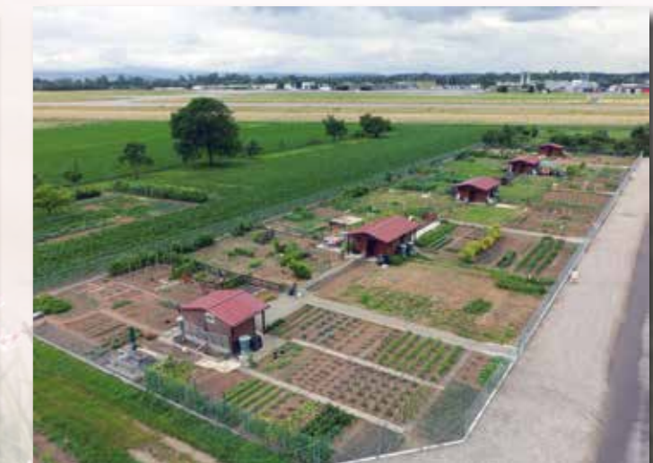
Vue d'ensemble des jardins familiaux