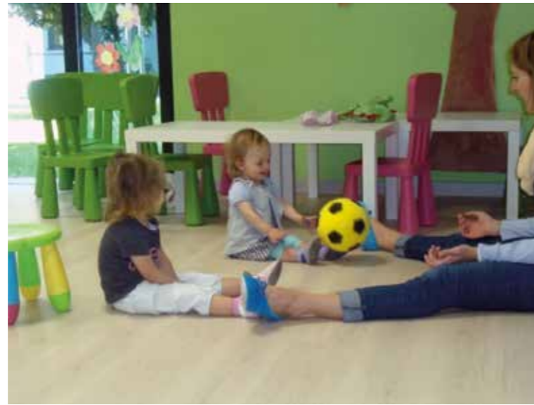
Jeux de ballon