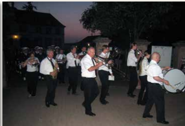
A la tombée de la nuit, les lampions ont été distribués aux enfants. Les participants ont ensuite participé nombreux aux festivités, avec le bal populaire et le grand feu d'artifice musical.