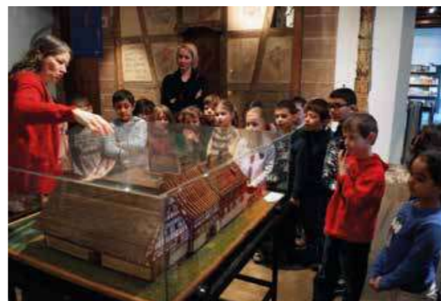
La visite des CP et CE1 au musée alsacien.