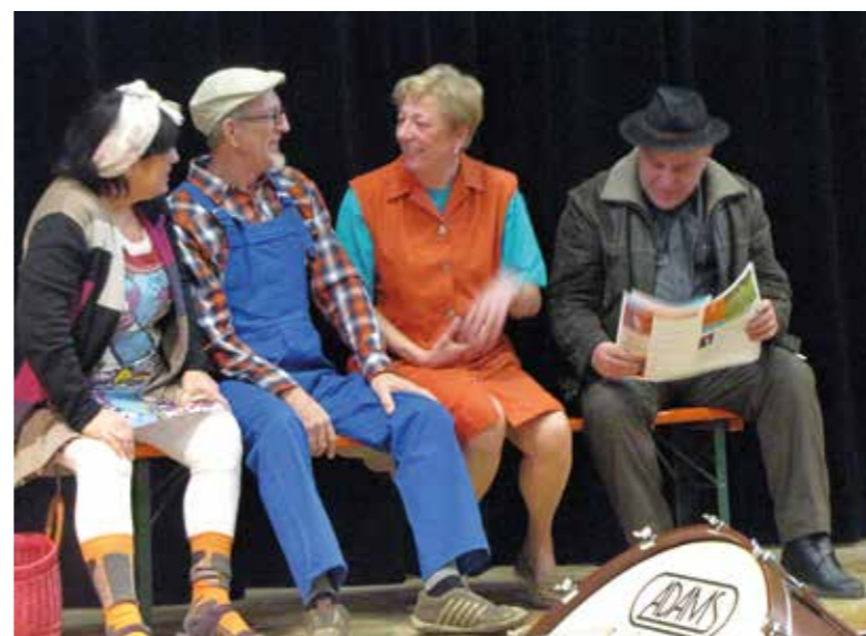
Sketch présenté le 1 er décembre lors de la fête des aînés

Les 18, 19, 25 et 26 janvier, et les 1, 2, 15 et 16 février, nous vous présenterons: « Hallodria, uff'um Traumscheff ». « La croisière s'amuse », pourrait-on dire... Tantôt à bâbord, tantôt à tribord... que de remous durant ce voyage de rêve !