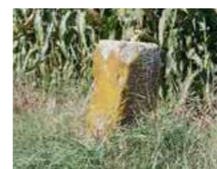
□ Borne ancienne ( Dorfzeichen ) en limite des bans d'Entzheim et de Blaesheim (avec blason des familles Zorn et Bock)

► Le garde-champêtre ou bangard (Bannwart) : Chargé de surveiller le ban communal, une fois élu (pour un an en général) et investi par le Schultz, il jurait de protéger les biens et les récoltes tant des riches que des pauvres . Lorsqu'il surprenait l'auteur d'une infraction, son autorité se bornait à lui réclamer un forfait (amende) reversé au seigneur.