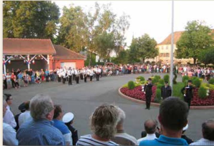
La traditionnelle cérémonie de la fête nationale a eu lieu le 13 juillet devant une forte affluence et sous un temps ensoleillé.